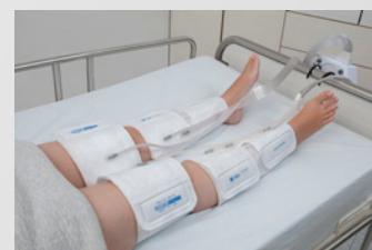
4 attelles mollet et cuisse