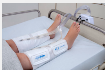
4 attelles mollet