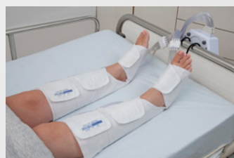
4 attelles mollet et pied