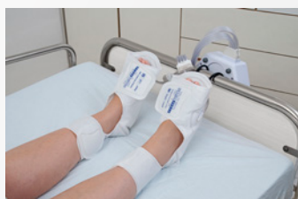
1 attelle pied

Plusieurs configurations sont possibles afin de répondre au mieux aux besoins des patients et des risques.