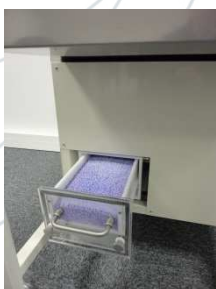
Table d'euthanasie gazeuse CO2 mobile